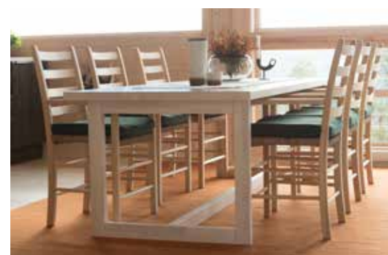
Jærstol m/4 sprosser og armlene. Pute til jærstol.