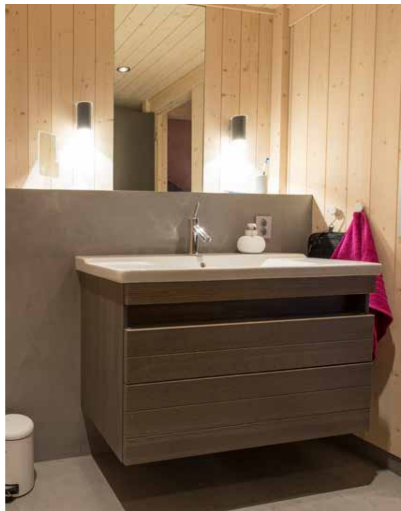
Servantskap med skuffer og heldekkende servant. Finnes i bredde 60, 90 og 120 cm.