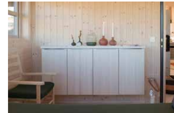
Ålskjenk, vegghengt L: 160 H: 75