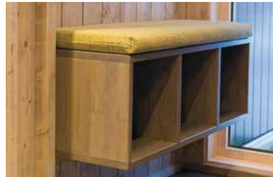
Kube3 med pute som garderobebenk.