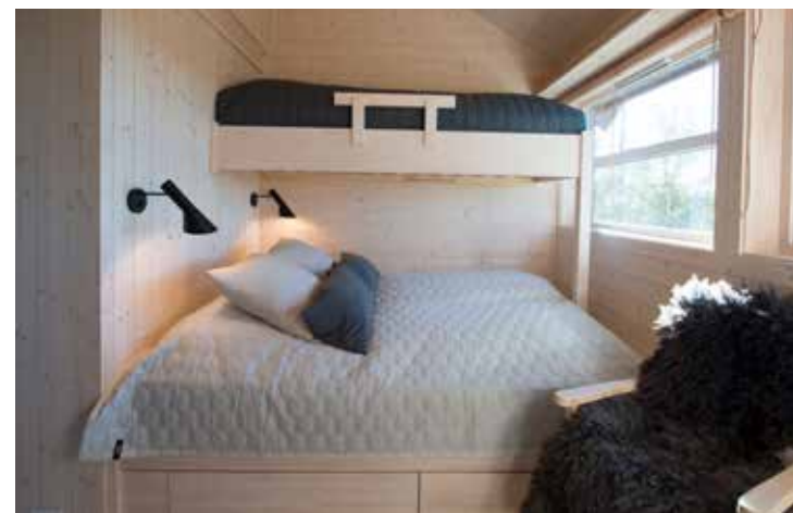
Familiekøye med skuffekassetter, stige medfølger.