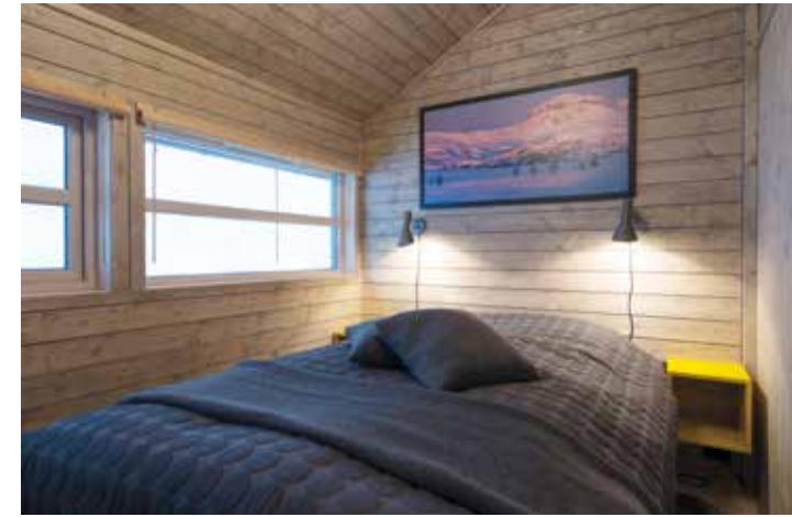
Frittstående seng 150 x 200.