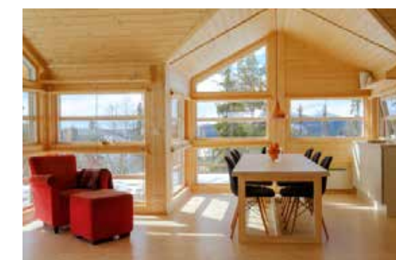
Spisebord, Eames spisestuestol og Ålsjenk på sokkel.