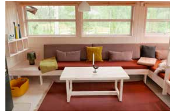
Sofabenk med rette puter og salongbord.