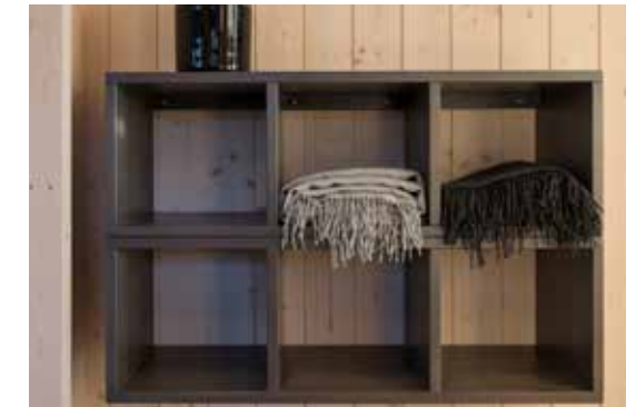
Kube3 x 2 som oppbevaringshylle.