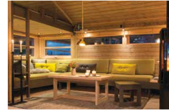
Sofabenk med rette puter, salongbord. Krakk, B: 40 L: 40 H: 40