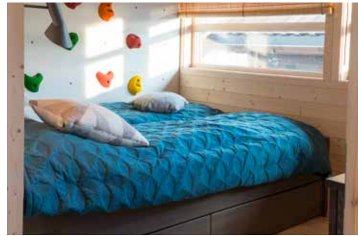
Soverom med klatrevegg.