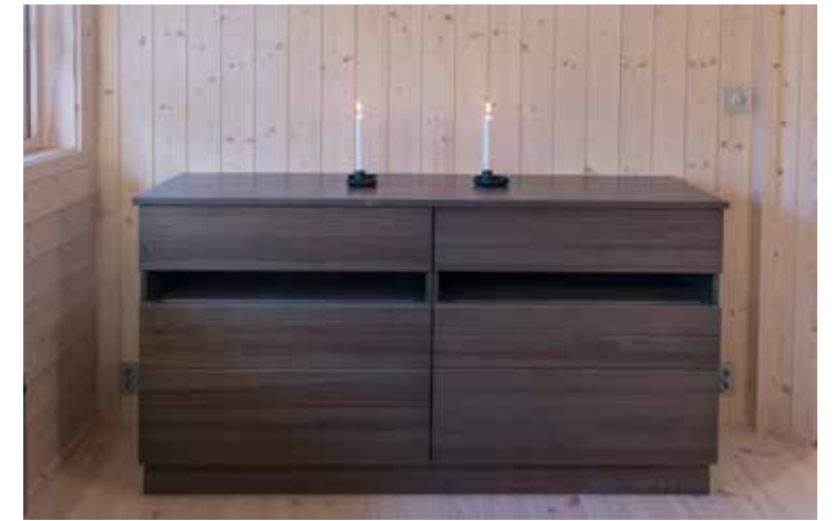
Kommode m/3 skuffer. B: 80 D: 45 H: 85 Her vist 2 kommoder med hel topplate.