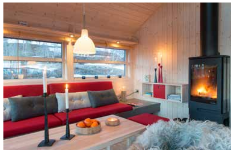
Sofabank med rette puter. Kube3 hylle og peisovn.