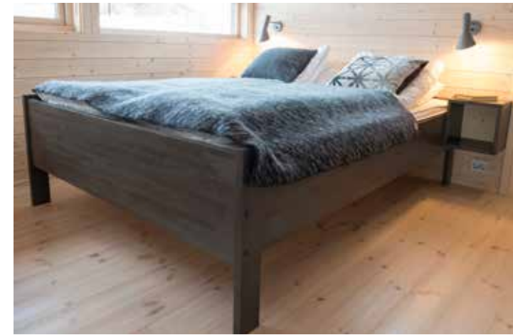
Frittstående seng 150 x 200, beis. (Ny modell avviker noe fra bildet).