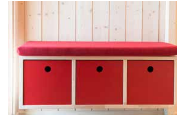
Kube3 med pute som garderobebenk. Her vist med 3 kubeskuffer.