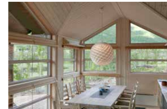
Patera lampe over spisebord. Jærstol m/4 sprosser og armlene.