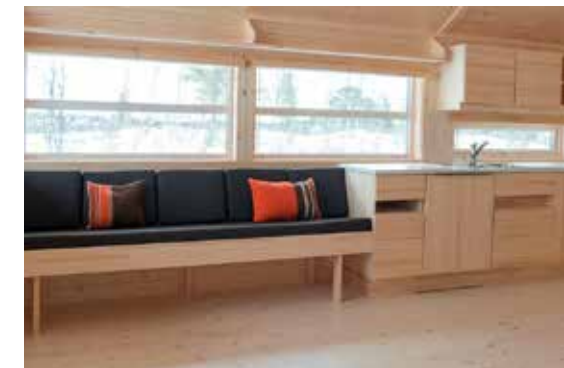
Spisebenk, leveres etter mål, kan også leveres som hjørne.

B: 40 L: 180 H: 5 B: 40 L: 210 H: 5 B: 40 L: 240 H: 5