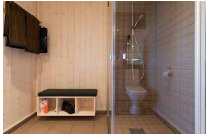
Kube3 som sittebenk på bad.