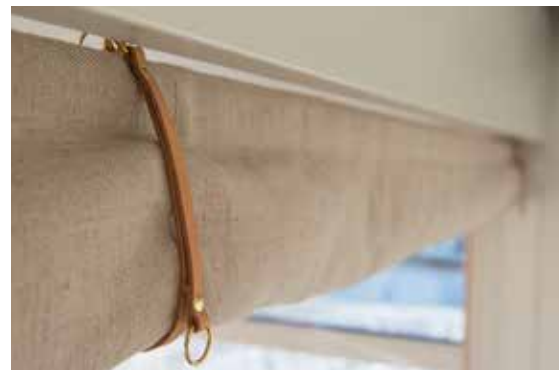
Seilduksgardin til 1. etg karnapp.