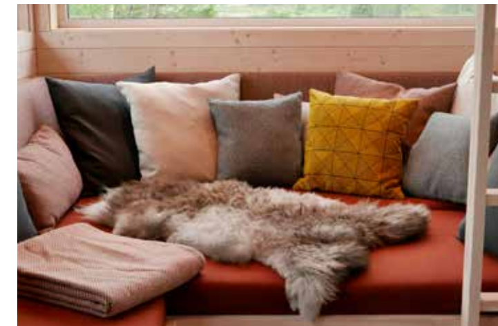
Karnapp i stue, kan enkelt benyttes som ekstra soveplass.