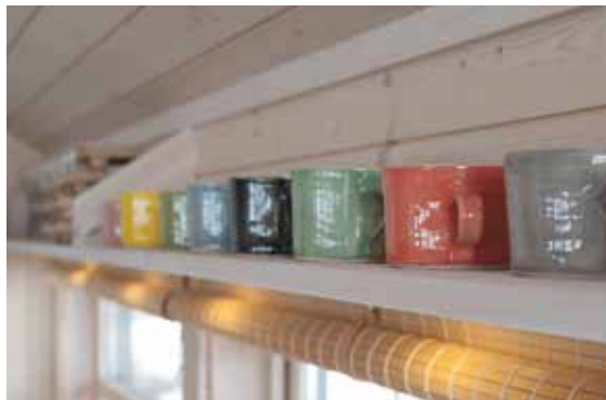
Hylle over vindu.