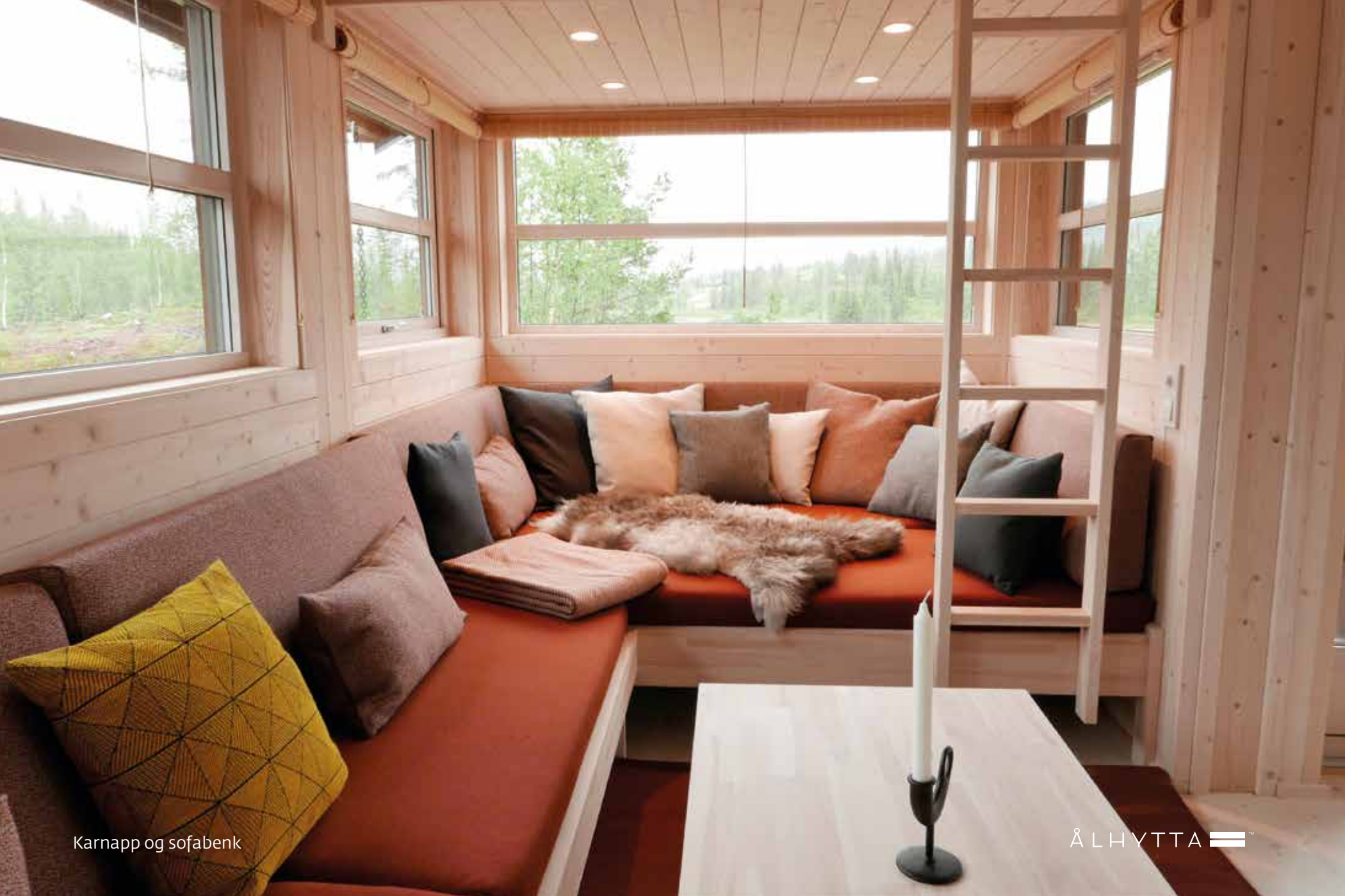
Karnapp og sofabenk