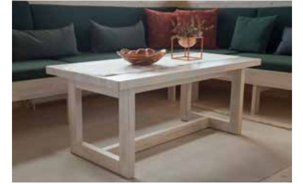
Salongbord, B: 60 L: 120 Salongbord, B: 70 L: 130