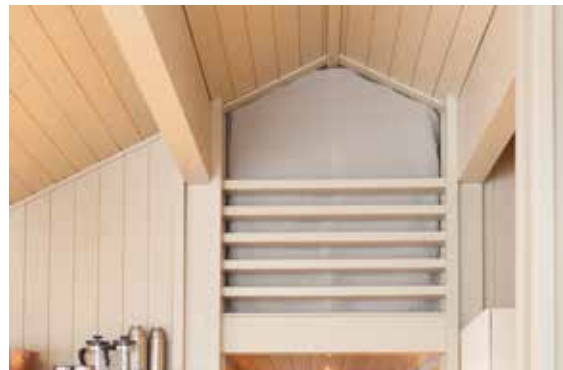
Seilduksgardin for hems.