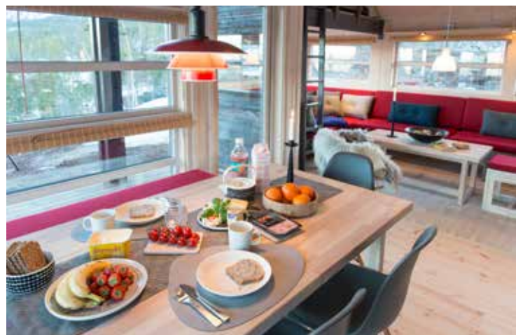
Stue med spise plass, sofabank, salongbord og krakk.