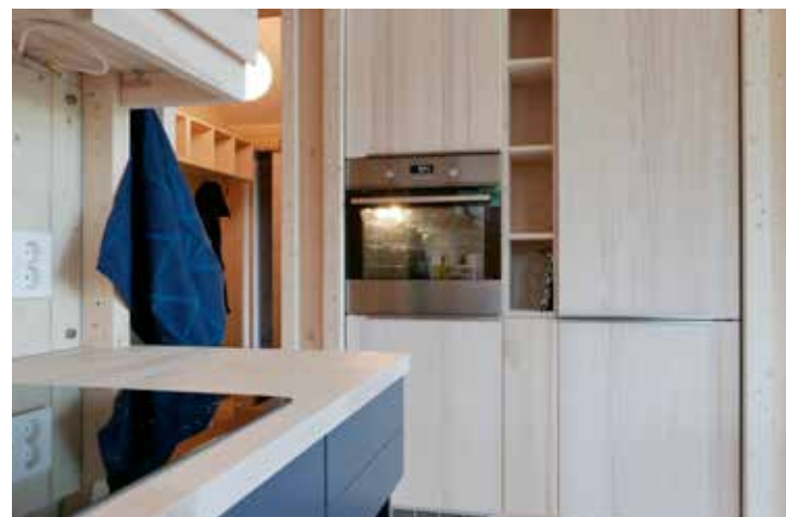
Kjøkkennisje med stekeovn.