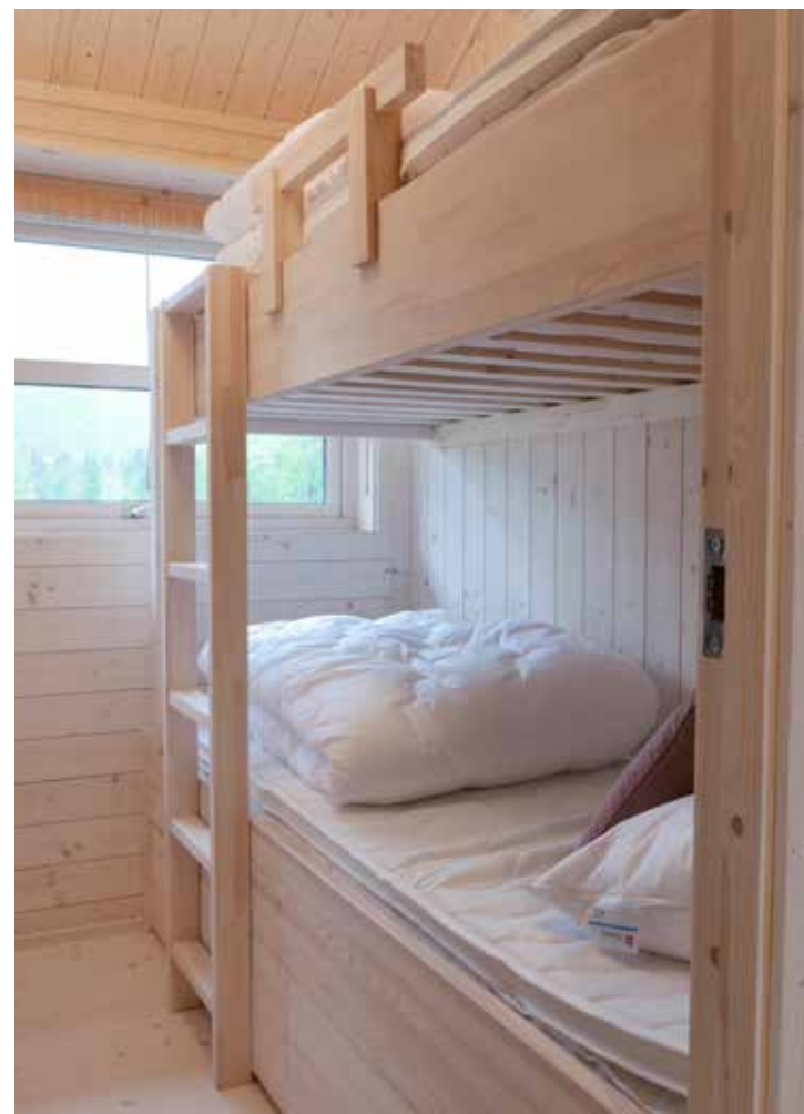
Køyeseng med skuffekassetter.