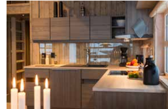
Ålkjøkken Kan leveres med ulike overflatebehandlinger.