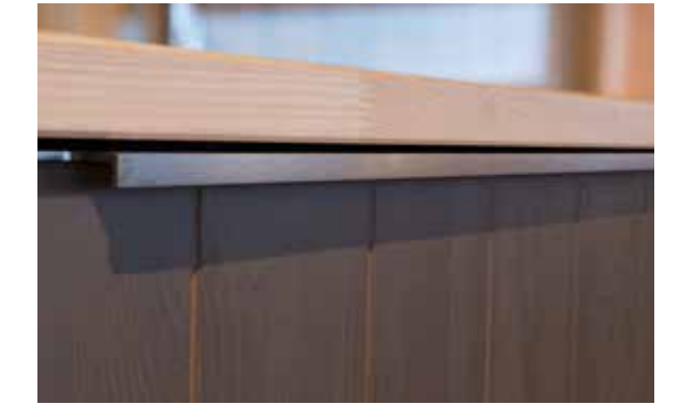
Grep for oppvaskmaskin og for alle høye dører.