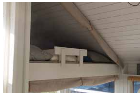
Trekantgardin, seilduk, til 2. etg karnapp.