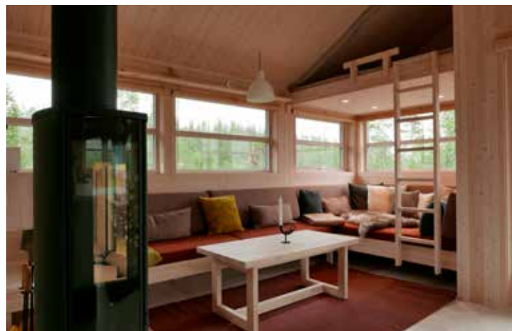
Sofabank med karnapp og ekstra soveplass