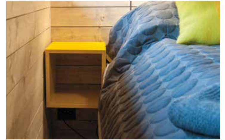
Kube1, som nattbord. B: 30 D: 30 H: 30