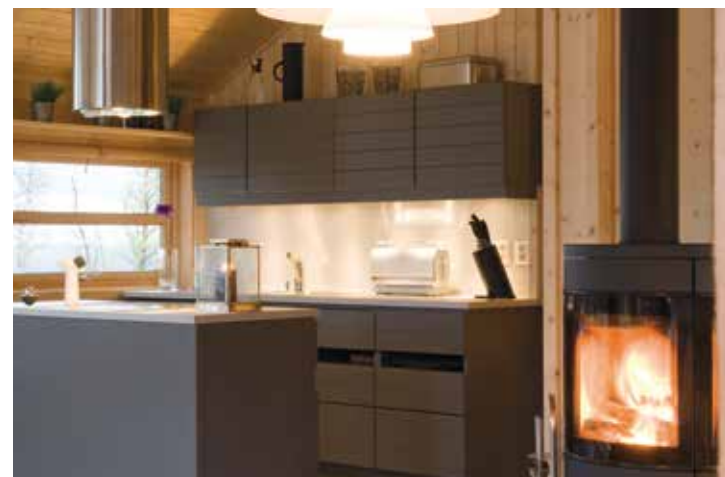
Ålkjøkken, malt utførelse.