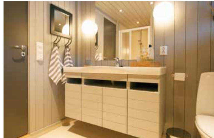
Ålbad 120 cm servantskap og heldekkende servant, malt. Avbildet med skap. Leveres nå med brede skuffer.