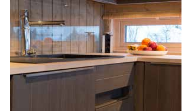
Benkeplate ask Flere valgmuligheter i laminat og heltre.