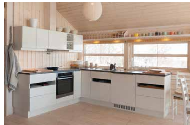
Ålkjøkken, malt utførelse.