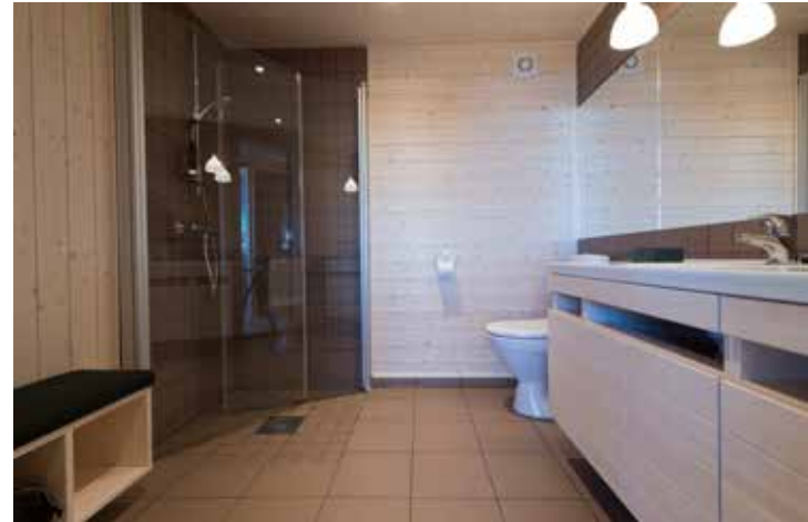
Ålbad 120 cm servantskap og heldekkende servant. Her avbildet med skap. Leveres nå med brede skuffer.