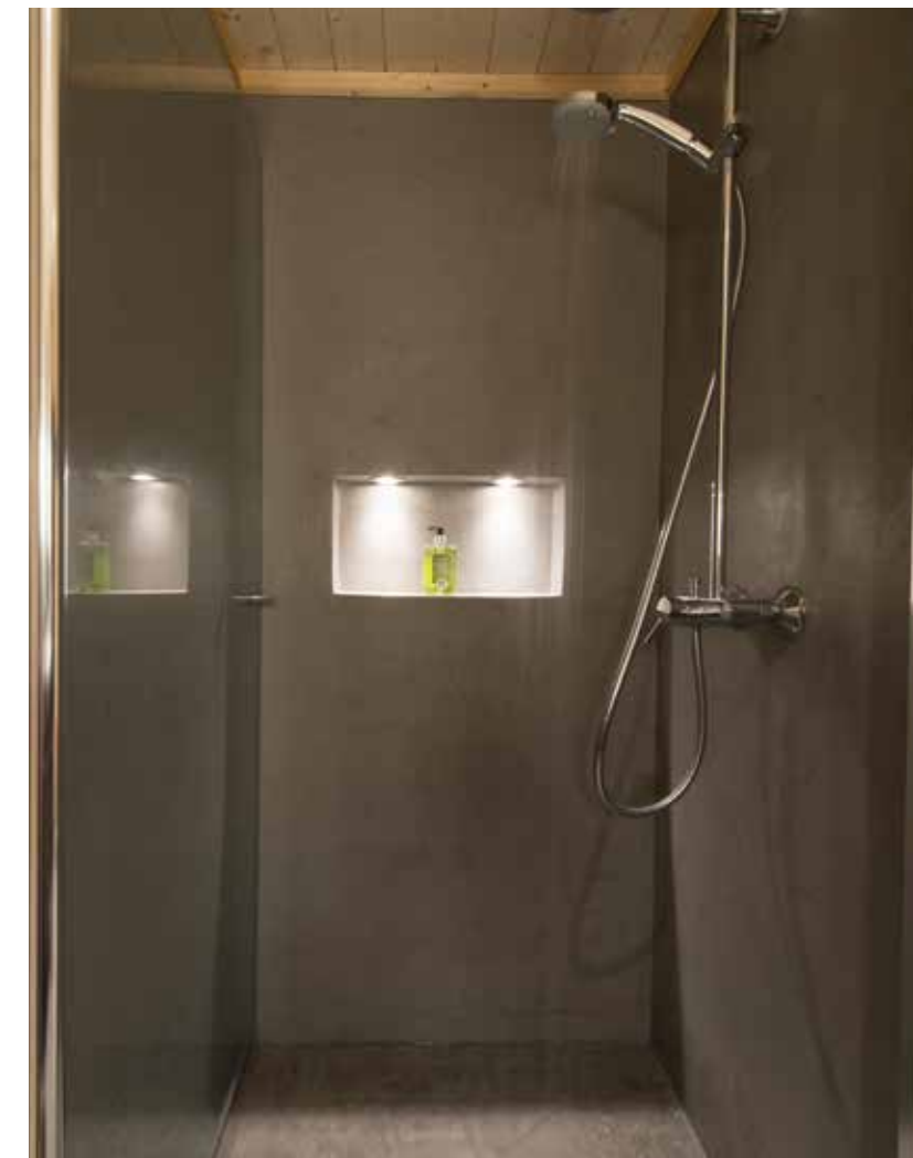
Dusjnise i betong