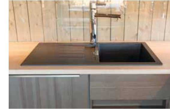
Kjøkkenvask Flere valgmuligheter i stål og kompositt.