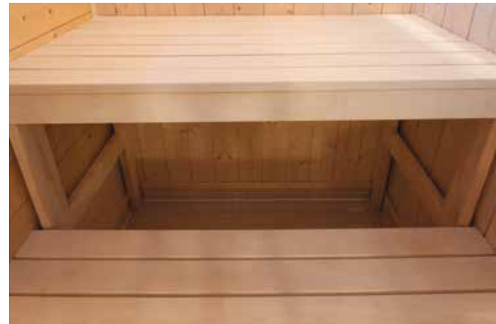
Badstuebenk i osp.