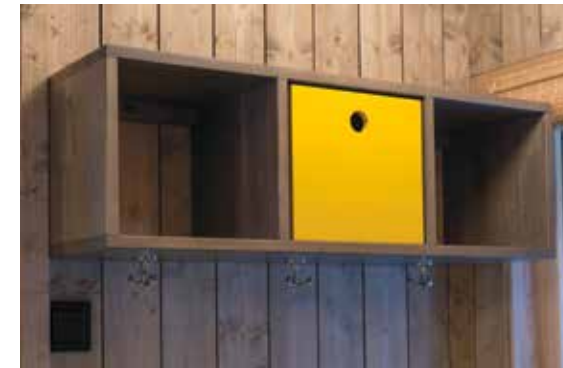
Kube3 med kroker og kubeskuff som garderobehylle.